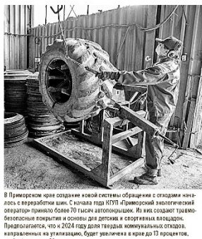
В Приморье в настоящее время перерабатывают более 70 тысяч автокрышек в год. Это позволяет уменьшить количество отходов и использовать полученную крошку в различных целях.