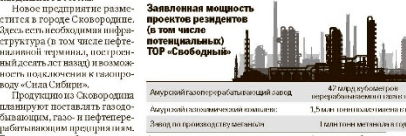
Активность по привлечению инвестиций Амурской области

Инициатором проекта выступил инвестор из Китая. Проект предусматривает строительство завода мощностью 1,5 миллиона тонн метанола в год.